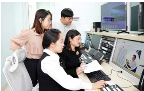
Nhóm tác giả là phóng viên Báo Quảng Ngãi đoạt giải A Giải Búa liềm vàng tỉnh lần thứ II - năm 2024 trao đổi nghiệp vụ.

Hiện nay, cùng với cá nước, Quảng Ngãi đang trong đợt cao điểm triển khai công tác chống khai thác hải sản bất hợp pháp, không khai báo và không theo quy định (IUU). Quảng Ngãi coi đây là nhiệm vụ đặc biệt quan trọng và cấp bách, huy động sự tham gia của cả hệ thống chính trị, quyết tâm cùng cả nước gỡ "thẻ vàng" thủy sản. Cùng với kiến quyết xử lý nghiêm các