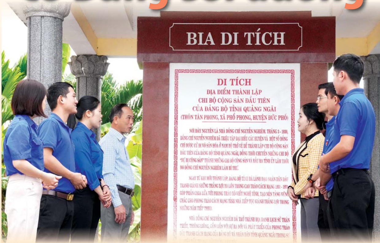
Di tích địa điểm thành lập Chi bộ Cộng sản đầu tiên của Đảng bộ tỉnh Quảng Ngãi ở xã Phổ Phong (TX. Đức Phổ).