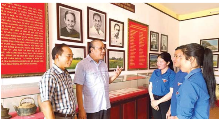
Ông Phạm Minh Chính (thứ hai, bên trái), cháu ngoại nguyên Bí thư Tỉnh ủy Quảng Ngãi Nguyễn Nghiêm, trò chuyện cùng đoàn viên, thanh niên xã Phố Phong (TX.Đức Phổ) tại Nhà lưu niệm đồng chí Nguyễn Nghiêm.