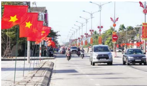
Mừng Đảng, mừng Xuân mới, nhiều tuyến đường trong tỉnh treo cờ Tổ quốc rực rỡ.

1975, Đảng ta tiếp tục lãnh đạo nhân dân đạt được nhiều thành tựu trong công cuộc khôi phục, hàn gắn vết thương chiến tranh, xây dựng và bảo vệ vững chắc biên cương Tổ quốc; thực hiện thắng lợi sự nghiệp đổi mới. Từ thực tiễn sinh động 95 năm có Đảng đã khẳng định sự lãnh đạo đúng đắn của Đảng là nhân tố hàng đầu quyết định mọi thắng lợi của cách mạng Việt Nam, viết nên những trang sử vàng chói lọi về chủ nghĩa anh hùng cách mạng của dân tộc ta. Đảng Cộng sản Việt Nam là Đảng chân chính duy nhất của dân tộc Việt Nam, là đội tiên phong của giai cấp công nhân, đồng thời là đội tiên phong của