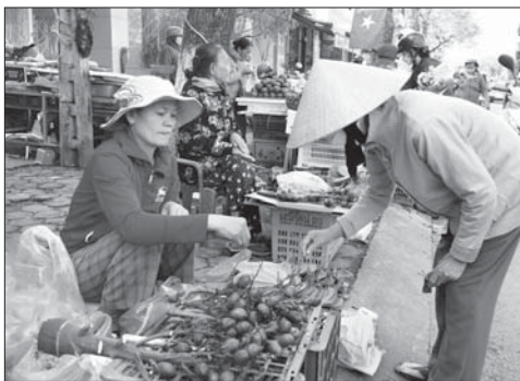
Các sạp hàng bán trâu, cau đất hàng trong phiên chợ sáng mùng 3 Tết.

Như thường lệ, nhiều người đến chợ trước tiên tìm đến những mẹt trâu, cau chỉ để mua lộc. Lá trâu được các bà, các mẹ chọn lựa rất kỹ càng, tươi xanh, xếp thành