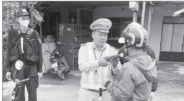
Lực lượng cảnh sát giao thông kiểm tra nồng độ cồn người điều khiển mô tô.