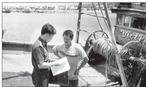
Cán bộ Trạm Kiểm soát Biên phòng Sa Huỳnh (TX.Đức Phổ) tuyên truyền, hướng dẫn ngư dân thực hiện các quy định trong chống khai thác IUU.

Trong năm 2024, Chi cục Thủy sản tỉnh đã phối hợp với chính quyền các địa phương thực hiện 2 đợt kiểm tra, rà soát số lượng tàu cá "3 không". Trong đó, đợt 1 có 1.087 tàu cá "3 không", nhưng sau đó đã loại 290 tàu. Nguyên nhân là trong số 290 tàu này có những tàu có