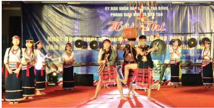
Tiết mục biểu diễn cồng chiêng, múa cà đào của học sinh Trường Phổ thông Dân tộc bán trú THCS Trà Thủy (Trà Bồng).

Đây là một trong những hoạt động ý nghĩa, tạo điều kiện để giáo viên và HS trải nghiệm không gian văn hóa đặc sắc của dân tộc Cor. Cùng với đan lát, HS được trải nghiệm thi đánh cồng chiêng, múa cà đào, thi trang phục dân