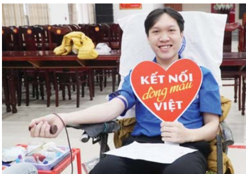
Bạn trẻ tham gia hiến máu đầu năm tại huyện Mộ Đức.