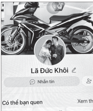
Zalo giả mạo quân nhân.

Để tạo niềm tin, sau khi kết thúc cuộc gọi, các đối tượng chủ động kết nối với chủ cơ sở kinh doanh bằng Zalo giả mạo quân nhân; trao đổi thông tin về số lượng hàng hóa, suất ăn dự định sẽ đặt cho đơn vị và yêu cầu gửi báo giá. Sau khi nhận báo giá, để tạo "niềm tin", các đối tượng chủ động đề nghị chuyển khoản trước một số tiền