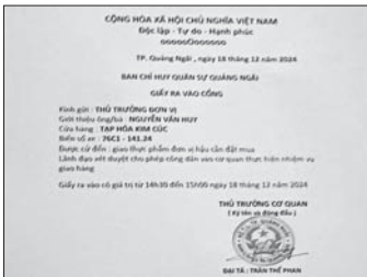
Các giấy tờ giả mạo đơn vị quân đội.

nhận tiền, các đối tượng liên hệ khóa tài khoản, cắt liên lạc với nạn nhân và chiếm đoạt toàn bộ số tiền. Bằng thủ đoạn lừa đảo này, các đối tượng đã lừa của bà N.T.T, chủ một cửa hàng tạp hóa tại phường Nghĩa Lộ (TP.Quảng Ngãi) với số tiền hơn 50 triệu đồng.