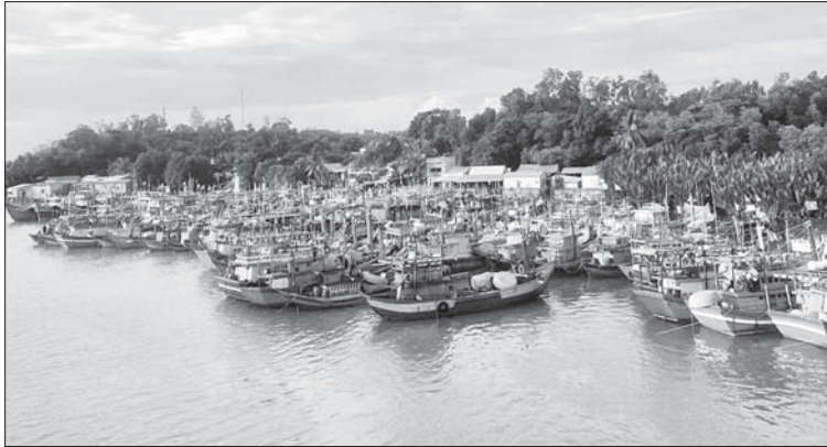
Việc xóa tàu cá "3 không" là một trong những tiêu chí quan trọng trong chống khai thác IUU. Trong ảnh: Tàu cá của ngư dân neo trú tại cửa biển Sa Cán (Binh Sơn).

Phó Chủ tịch UBND xã An Phú Võ Khánh cho biết, UBND xã đã phối hợp với các cấp, cơ quan chức năng tổ chức các buổi gặp gỡ, đối thoại với ngư