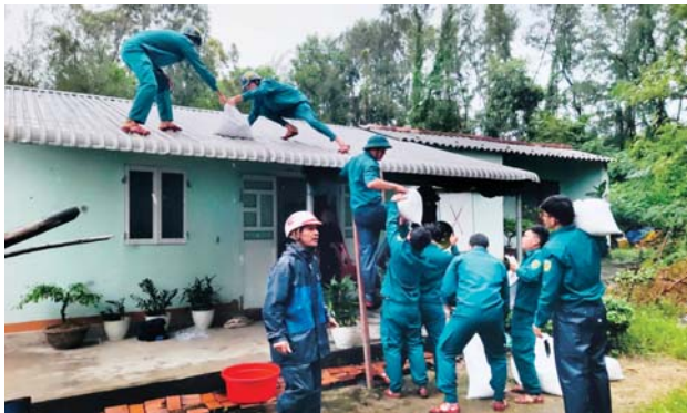
Lực lượng xung kích phòng, chống thiên tai xã Bình Hải (Bình Sơn) giúp dân chằng chống nhà cửa phòng, chống bão số 6 (TRAMI).

Đến chiều 26/10, các địa phương đã xác định cụ thể số hộ dân cần di dời, sơ tán là 1.013 hộ dân, với 4.003 nhân khẩu. Tuy nhiên, căn cứ tình hình diễn biến của bão số 6 và mức độ, cường độ mưa, đến chiều tối 26/10, các huyện Lý Sơn, Sơn Hà, Trà Bồng đã tổ chức sơ tán 163 hộ dân, với 539 nhân khẩu ở vùng nguy cơ sạt lở đến nơi an toàn.