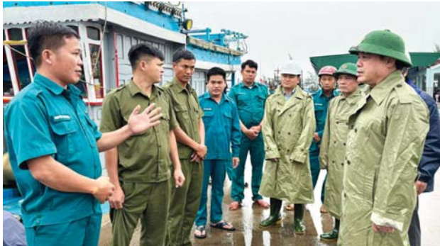
Phó Chủ tịch Thường trực UBND tỉnh Trần Hoàng Tuấn kiểm tra công tác ứng phó với bão số 6 (TRAMI) tại cảng Tịnh Hòa (TP. Quảng Ngãi).