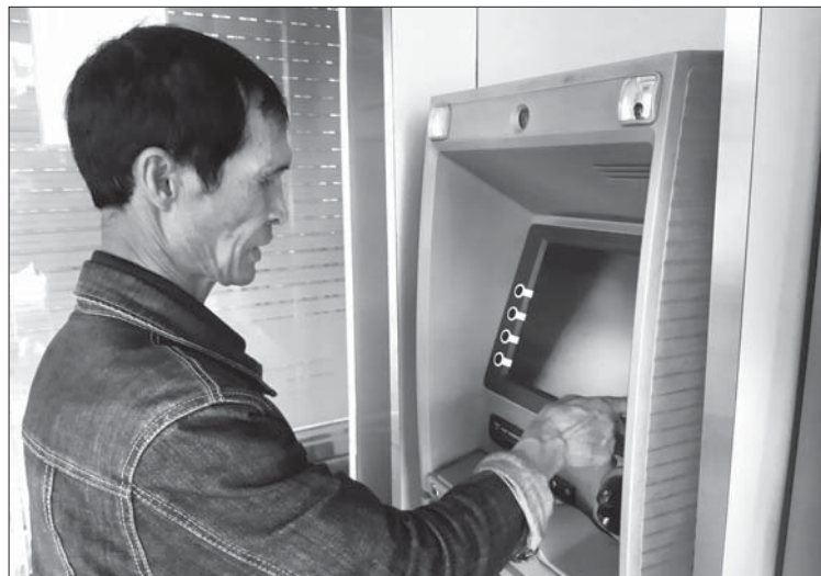
Người dân thị trấn Châu Ổ (Bình Sơn) rút tiền tại trụ ATM.