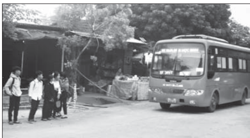
Học sinh đón xe buýt tuyến xã Ba Điện - thị trấn Ba Tơ (Ba Tơ).

Việc HS điều khiển xe máy đến trường không chỉ vi phạm các quy định pháp luật về trật tự, an toàn giao thông (ATGT), mà còn tiềm ẩn nhiều nguy cơ gây tai nạn giao thông. Bởi lẽ, ý thức khi tham