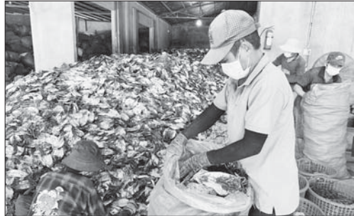
Phát triển vùng nguyên liệu thủy sản tập trung là một trong những nhiệm vụ của Chi cục Phát triển nông thôn, Quản lý chất lượng và thị trường nông sản tỉnh. Trong ảnh: Sơ chế mực và tía cựa ở Hưng Giao, xã Bình Chánh (Bình Sơn).