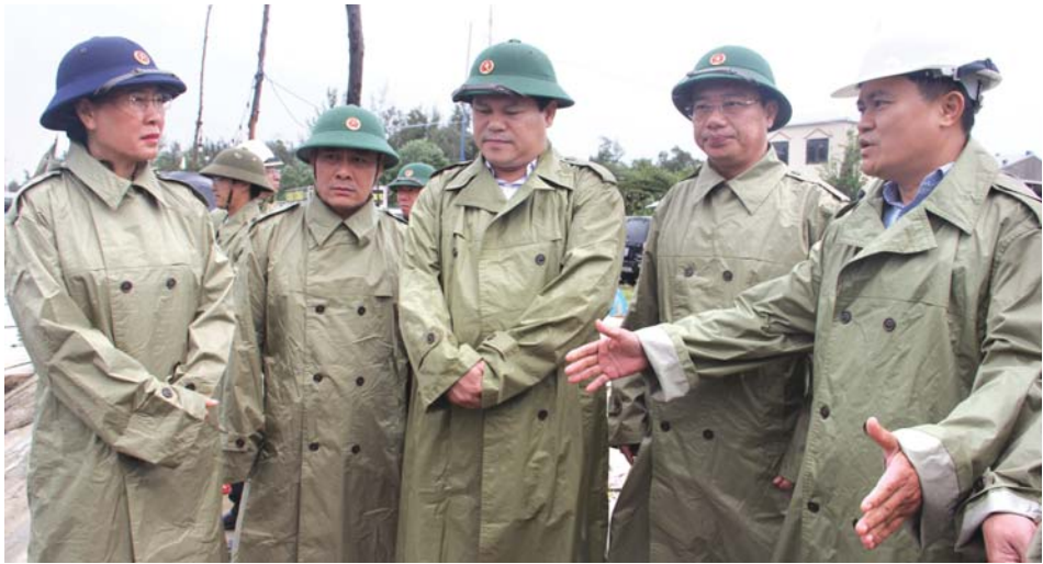
Ủy viên Trung ương Đảng, Bí thư Tỉnh ủy, Chủ tịch HĐND tỉnh Bùi Thị Quỳnh Vân nghe báo cáo tình hình neo đậu tàu thuyền tại thôn Tuyệt Diêm 1, xã Bình Thuận (Bình Sơn).

Theo Văn phòng Thường trực Ban Chỉ huy PCTT&TKCN tỉnh, các địa phương trên địa bàn tỉnh đã theo dõi sát diễn biến của bão số 6 và lưu lượng mưa, linh hoạt triển khai công tác ứng phó phù hợp với từng vùng, khu vực. Đối với 5 huyện miền núi của tỉnh, có 67 điểm có nguy cơ cao sạt lở đồi, núi và lũ quét.