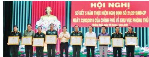
Phó Chủ tịch Thường trực HĐND tỉnh Nguyễn Cao Phúc trao Bằng khen của Chủ tịch UBND tỉnh cho các cá nhân.