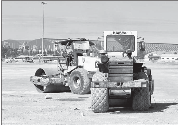
Thi công đường giao thông trong Khu Kinh tế Dung Quất.