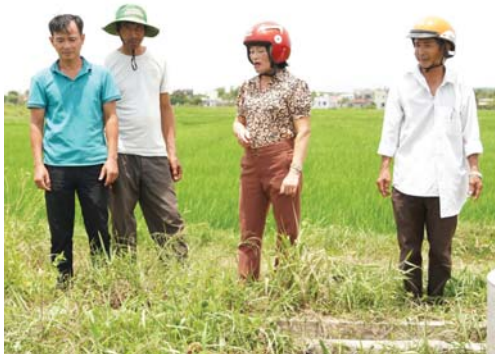
Các thành viên Ban Giám sát đầu tư công đồng xã Bình Long (Bình Sơn) kiểm tra công trình tuyến mương vùng 3, thôn Long Mỹ.

Cuối năm 2023, trên địa bàn thôn Long Mỹ, xã Bình Long (Bình Sơn) thi công tuyến mương vùng 3 thuộc Chương trình kiên cố hóa kênh mương loại III, nhằm khắc phục tình trạng thiếu nước sản xuất. Đây là công trình do Nhà nước và nhân dân cùng làm, với tổng kinh phí 40 triệu đồng. Với chức năng, nhiệm vụ của mình, Ủy ban MTTQ Việt Nam xã Bình Long đã thành lập Ban Giám sát đầu tư công đồng công trình tuyến mương thuộc thôn Long Mỹ. Theo đó, 5 thành viên trong Ban giám sát đã theo dõi từng phân việc, kiểm tra chất lượng công trình đảm bảo theo dự toán và thiết kế. Qua việc giám sát, công trình đã hoàn thành đúng tiến độ, đảm bảo chất lượng và đưa vào sử dụng hiệu quả, phục vụ nước tưới cho cánh đồng có