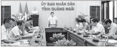
Phó Chủ tịch UBND tỉnh Trần Phước Hiến phát biểu kết luận cuộc họp.

Phát biểu tại cuộc họp, Phó Chủ tịch UBND tỉnh Trần Phước Hiến nêu rõ việc xây dựng quy định mới về bồi thường, hỗ trợ, TĐC khi Nhà nước thu hồi đất nhằm khắc phục tối đa các hạn chế đã được chỉ ra trong quy định cũ. Đặc biệt là, phải thực hiện chính sách TĐC "nơi ở mới phải hơn nơi ở cũ". Khu TĐC phải xây dựng theo tiêu chuẩn đô thị, với hạ tầng đảm bảo, không thể xây ở vị trí xa xôi, hẻo lánh. Chính