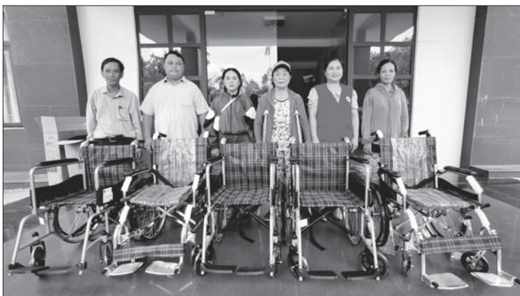
Tặng xe lăn cho người khuyết tật, bệnh tật tại huyện Ba Tơ.

Năm 2024, chương trình được triển khai tại các xã Hành Tín Tây, Hành Tín Đông, Hành Thiện, Hành Dũng, Hành Thuận (Nghĩa Hành) và Ba Vinh, Ba Vi, Ba Tò, Ba Động, thị trấn Ba Tơ (Ba Tơ). Nhân ngày Quốc tế thiếu nhi (1/6) năm nay, Hội Chữ thập đỏ tỉnh phối hợp với Văn