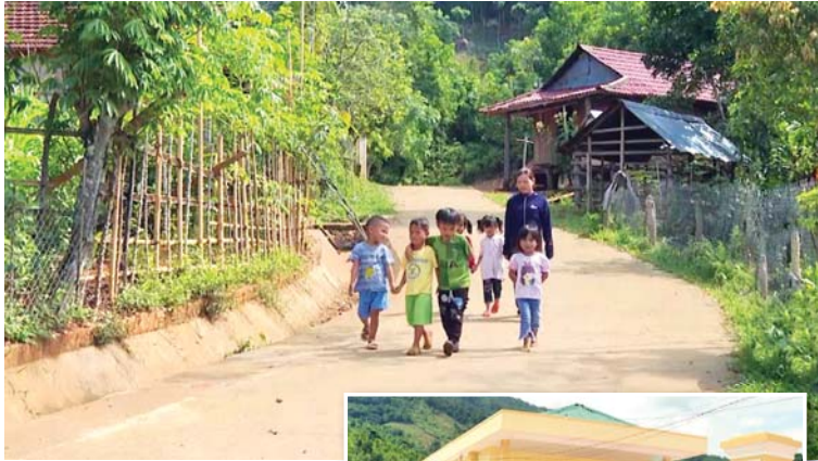
Đường giao thông ở xã Sơn Bua (Sơn Tây) được đầu tư từ Chương trình Mục tiêu Quốc gia phát triển kinh tế - xã hội vùng đồng bào dân tộc thiểu số và miền núi.

Nhà văn hóa thôn Huy Mãng, xã Sơn Dung (Sơn Tây) được xây dựng khang trang.