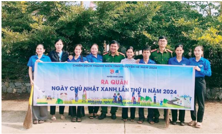
Thanh niên huyện Minh Long ra quân "Ngày Chủ nhật xanh" thực hiện vệ sinh môi trường, giúp đỡ cộng đồng.

Cùng với đó, thanh niên Minh Long đã thực hiện nhiều công trình, phần việc ý nghĩa, thiết thực như: "Chống rác thải nhựa", "Thứ 7 tình nguyện", "Ngày Chủ nhật xanh", với sự tham gia của hơn 1,6 nghìn lượt thanh niên. Đặc biệt, các hoạt động an sinh xã hội được duy trì như phối hợp tổ chức thăm và tặng quà cho các đối tượng cựu thanh niên xung phong, thương bệnh binh, gia đình chính sách, với tổng số tiền hơn 55 triệu đồng. Vận động hơn 3 nghìn lượt thanh niên đăng ký tham gia hiến máu, thu được hơn 2,8 nghìn đơn vị máu; tổ chức chương trình Tết vì người nghèo, tặng quà cho các gia đình có hoàn cảnh khó khăn, với tổng trị giá hơn 560 triệu đồng. Hỗ trợ xây dựng và sửa chữa 11 "Nhà nhân ái", với tổng số tiền hơn 414 triệu đồng. Xây mới 6