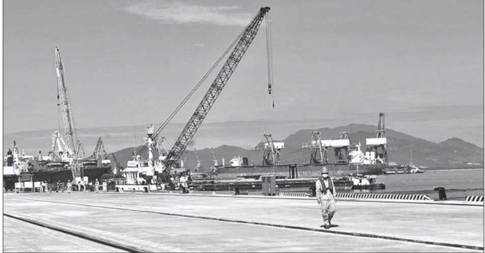
Khu Kinh tế Dung Quất sẽ tiếp tục thu hút đầu tư hạ tầng cảng biển. Trống ảnh: Cảng Hòa Phát Dung Quất.

Cụ thể, ưu tiên thu hút 3 dự án liên quan đến xử lý rác và cấp nước, gồm Nhà máy Xử lý rác sinh hoạt kết hợp phát điện Tịnh Phong; Khu liên hợp xử lý chất thải tổng hợp; Nhà máy Nước Dung Quất 2. Các dự án đầu tư hạ tầng đô thị, thương mại, dịch vụ, gồm: Khu Đô thị - Dịch vụ Nam sân bay Chu Lai; Khu Đô thị mới Lý Sơn; Khu Đô thị mới Đông Nam Dung Quất - phía bắc; Khu Đô thị mới Đông Nam Dung Quất - phía nam; Khu hậu cần cảng - logistics Bắc Dung Quất; các dự án đầu tư khu nhà ở công nhân, nhà ở thương mại; đầu tư du lịch, đô thị, nghỉ dưỡng. Riêng về hạ tầng KCN, công nghiệp, sẽ ưu tiên thu hút 6 dự án phù hợp với quy hoạch.